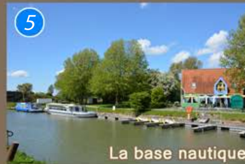
La base nautique