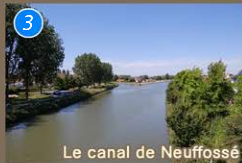
Le canal de Neuffossé