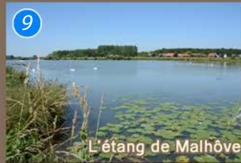
L'étang de Malhôte