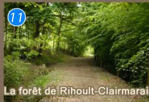
La forêt de Rihoult-Clairmarais