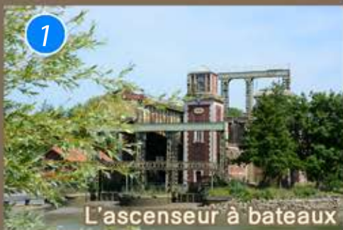
L'ascenseur à bateaux

les règlements, les interdictions ainsi que le code de la route pour votre propre sécurité.